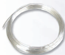
Plata Ref. 55008 0,8mm • 6m. Ref. 55025 0,6mm • 10m. Ref. 55035 0,4mm • 20m.