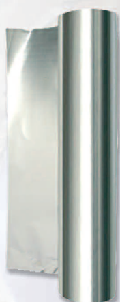
Rollo color Aluminio Ref. 26010 20 metros