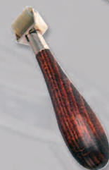
Rodillo goma Ref. 26202