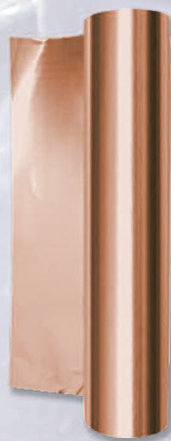
Rollo color Cobre Ref. 26030 10 metros