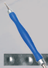
Doble puntas finas Ref. 26205