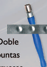
Doble puntas gruesas Ref. 26206 3mt