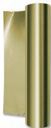
Rollo color Latón Ref. 26020 10 metros