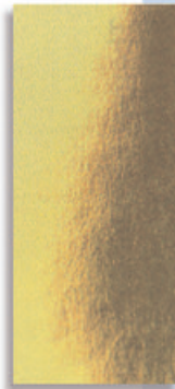
01 Blister 5 láminas oro brillante ó plata brillante Ref.: 19351