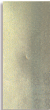
Blister 3 láminas cobre brillante, oro y plata mate Ref.: 19352